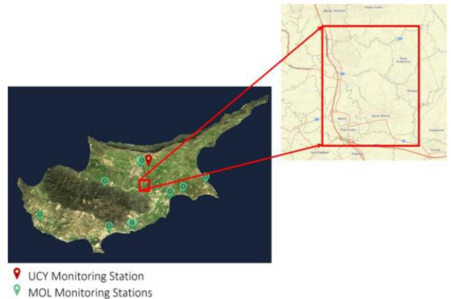
Εικόνα 2. Δίκτυο σταθμών παρακολούθησης αέρα στην Κύπρο [1]. Στο Δήμο Ιδαλίου δεν υπάρχουν εγκατεστημένοι σταθμοί μέτρησης.

Ο Δήμος Ιδαλίου παρόλη την ατμοσφαιρική ρύπανση παραμένει μια περιοχή όπου δεν υπάρχουν εγκατεστημένοι επίγειοι σταθμοί μέτρησης (βλέπε εικόνα 2), με απώτερο στόχο την ανίχνευση εισπνεύσιμων αιωρούμενων σωματιδίων και την έγκαιρη προειδοποίηση των κατοίκων.