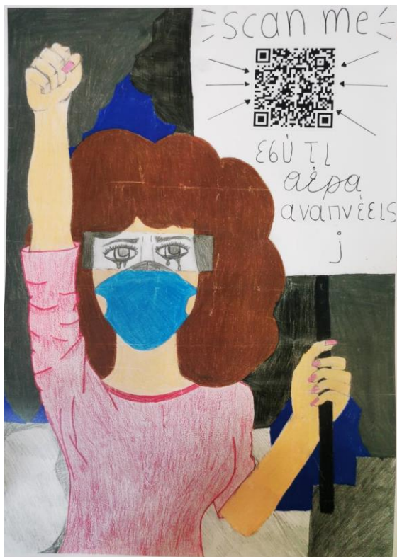
Εικόνα 3. Αφίσα προώθησης του ερωτηματολογίου και παράλληλα του τοπικού περιβαλλοντικού προβλήματος.

Το Μάρτιο του 2023, κάτοικοι της ευρύτερης περιοχής Ιδαλίου κλήθηκαν να απαντήσουν ένα ερωτηματολόγιο σε ηλεκτρονική μορφή, που δημιούργησε η ομάδα των Νέων Δημοσιογράφων, σχετικά με την ποιότητα του αέρα που αναπνέουν [4]. Για το σκοπό αυτό η ομάδα ετοίμασε αφίσα προώθησης του ερωτηματολογίου (βλέπε εικόνα 3). Τα ερωτηματολόγια δόθηκαν τόσο στη σχολική όσο και στην τοπική κοινότητα ώστε να έχουμε μια πληρέστερη εικόνα των προβληματισμών, των απόψεων και των γνώσεων που έχουν σχετικά με το θέμα της ποιότητας του αέρα. Στη διάρκεια προώθησης του ερωτηματολογίου η ομάδα των Νέων Δημοσιογράφων είχε την ευκαιρία να ενημερώσει και να προβληματίσει την κοινότητα για το τοπικό περιβαλλοντικό πρόβλημα.